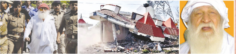
సంత ఆసారామ్ జీ బాపూపైన బూటకపుకేసు, ఆశ్రమాలను కూల్చడం | బాబా జయగురుదేవ్ పైన 21 నెలల దాకా జైలులో ధోర్కాణ్యలు |