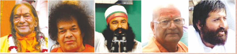
కృపాకుజ్జీ మహారాజ్ సత్యసాయి బాబా బాబా రామ్ హీమ్ స్వామీ కేశవానంద నారాయణ సాయి